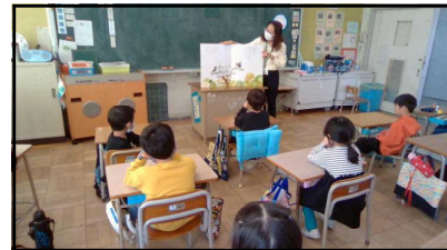
ブックトークの様子

本校では、読書の秋にちなんで「もりの子読書キャンペーン」を実施しました。活動内容は、読んだ本を他の学級の子に紹介したり、朝の国語学習の時間を読書の時間にあてたりしました。また、司書教諭によるブックトークも実施し、子どもたちが読書に親しむことができるよう取り組みました。